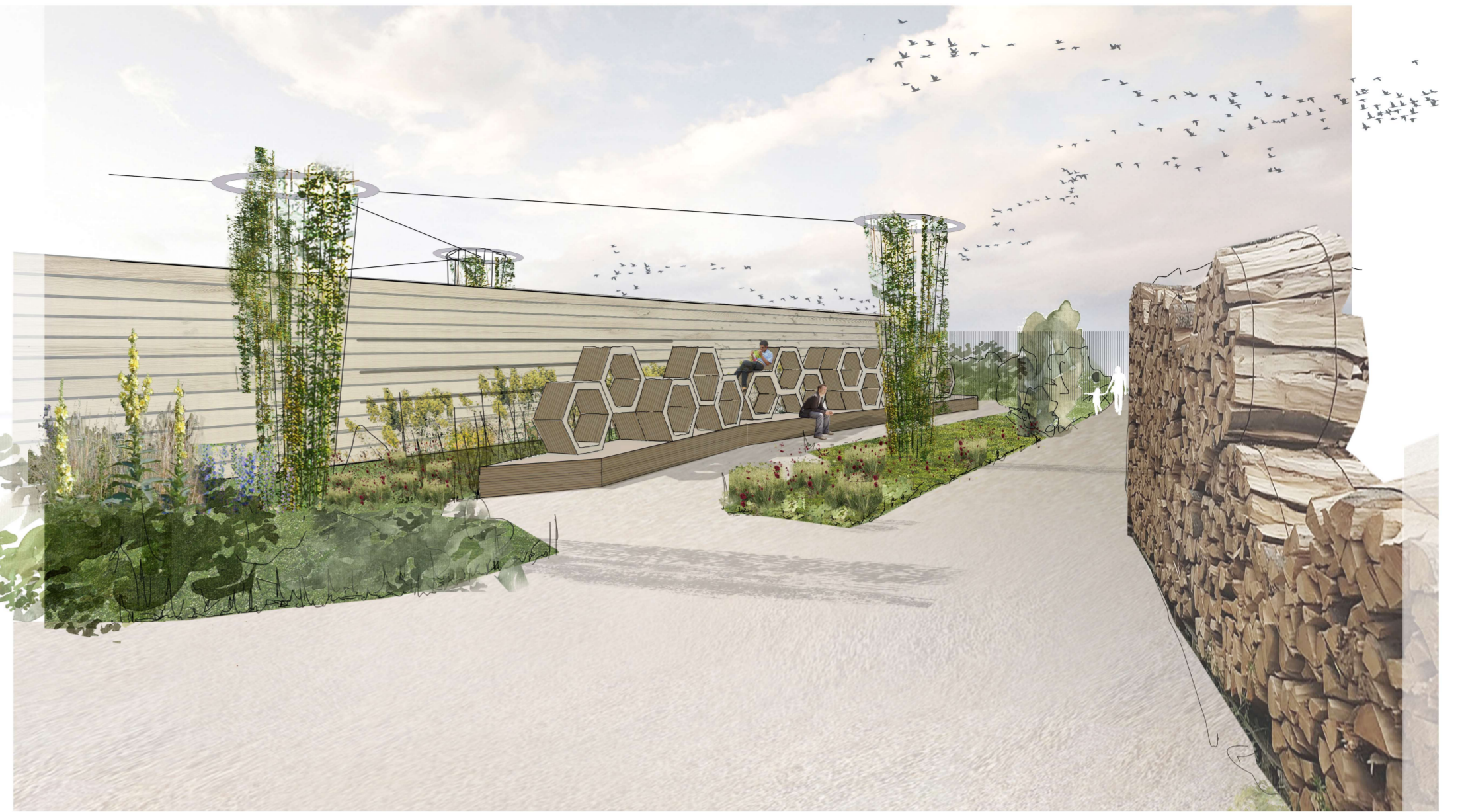
Blick auf südlichen Eingang und Wabenbank

Umsetzung durch formale Weiterführung der umliegenden Planung