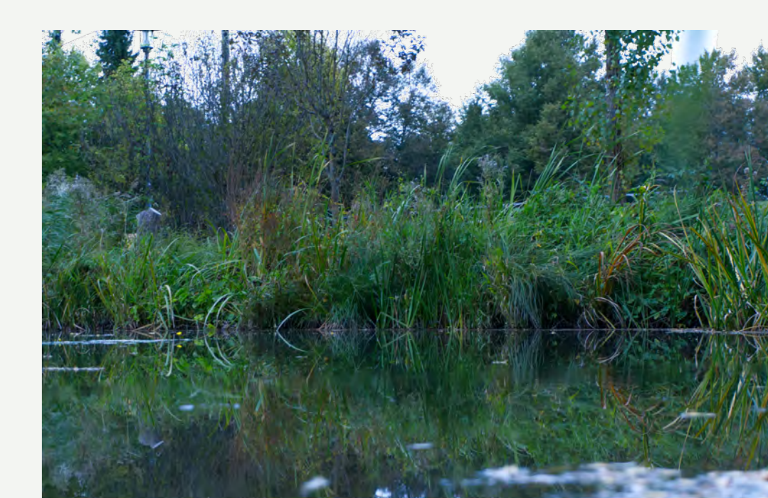
Teich mit Gräsern