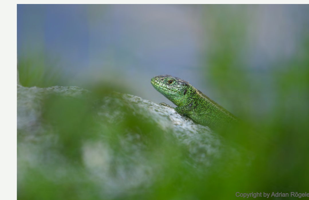
Lesehaufen als Rückzugsmöglichkeit für bspw. Zauneidechsen